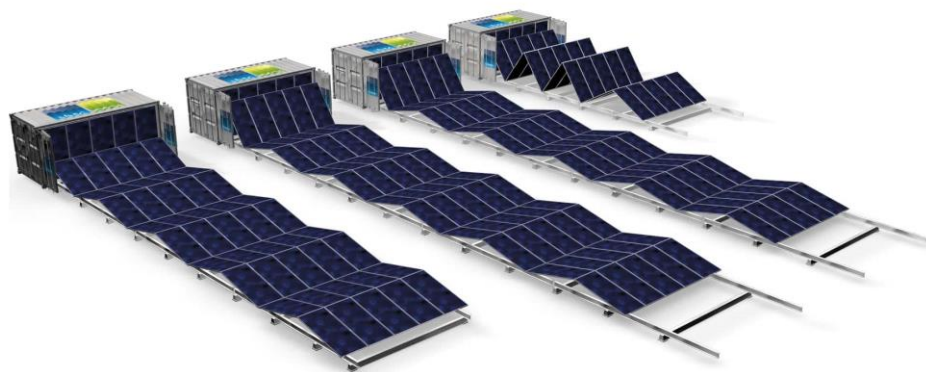
Visualisierung der Funktionsweise

Die PV-Box soll vor allem Unternehmen, welche durch die Energiekrise in Bedrängnis geraten sind und eine schnelle Lösung benötigen, Planungs- und Versorgungssicherheit gewährleisten.