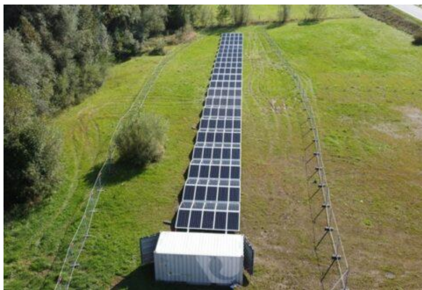
Erstes mobiles PV-Kraftwerk „PV-Box“ in Haag, Niederösterreich.